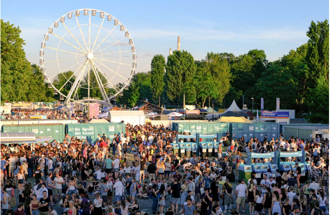
EIN ÜBERBLICK ÜBER DAS KESSEL FESTIVAL 2019.