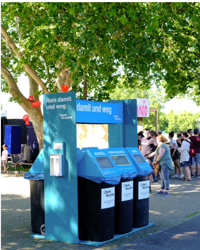
DIE KARLE RECYCLING INSELN – IDEAL AUF VERANSTALTUNGEN.

Am 1. und 2. Juni 2019 fand die Premiere des Kessel Festivals statt. Was das ist? Ein nachhaltiges Festival für jedermann und selbstverständlich jedefrau. Das umfangreiche Kultur-, Sport- und nicht zuletzt auch Musikprogramm bietet für jeden etwas, egal ob jung, ob alt, ob Musikliebhaber oder Adrenalinjunkie.