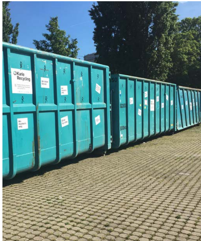
DAS FESTIVALGELÄNDE WAR UMGEBEN VON UNSEREN TÜRKISEN ABROLLCONTAINERN

Es war wirklich für jeden etwas dabei und bei den heißen Temperaturen und den vielen Sonnenstrahlen war das Festival-Wochenende einfach zum Genießen. Und auch in den kommenden Jahren freuen wir uns wieder darauf, dabei zu sein.